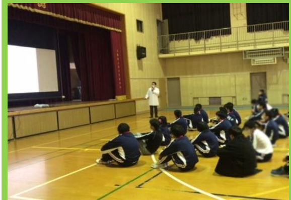
大阪府立思斉支援学校中学部