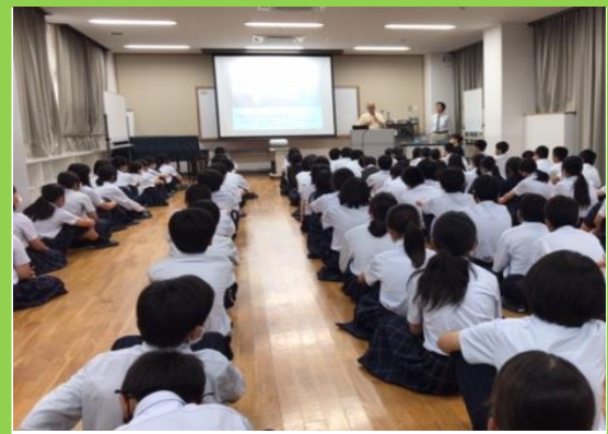
東大阪市立布施中学校